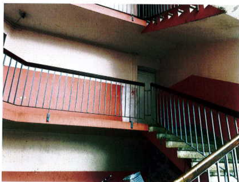
photographie 1 cage d'escalier